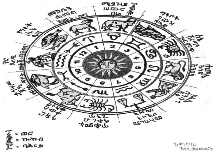
ክፍለ-ዓመት መሆናት ላይ የተወሰደ

ጀምሮ:- ዓገው ዳ. ገንጦት. ወፍግሌ. ገብረ-ገብረ. በግንባር-ደንበኛ. የጽሑፍ ፈቃድ ጽንፍ. ጠባብቶ. የተዘጋጀ. ብሔራዊ. ቅርጽ. ፊት. 1994 ዓ.ም.::